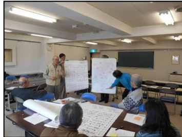
情報収集ワークショップの様子（H25.12.22）